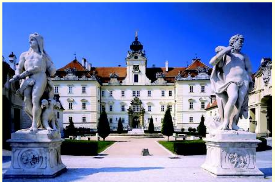
Schloss Feldsberg (Zámek Valtice) Tel. 00420/519/340128; www.breclav.info